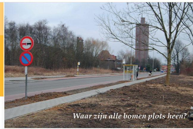
Waar zijn alle bomen plots heen?

Een Finse piste is een speciaal loopparcours voor joggers. Om het loopcomfort te verbeteren bestaat de bovenlaag uit een verende laag. De zachte, dempende toplaag geeft een aangenaam loopgevoel en voorkomt blessures. Door het verende effect van de toplaag worden de gewrichten aanzienlijk minder belast tijdens