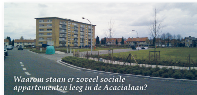
Waarom staan er zoveel sociale appartementen leeg in de Acacialaan?

Het gebrek aan sociale woningen in Vlaanderen wordt regelmatig aangehaald in de media. Waarom staan de sociale appartementen en huurwoningen in Hemiksem dan leeg? Volgens buurtbewoners en mensen die er vroeger woonden, wil men er niet meer komen wonen omdat de wijk een slechte reputatie heeft. Vroeger zorgden hangjongeren in de zomer voor overlast en men is bang dat dit scenario zich zal herhalen. In het verleden werd er wel een soort contract getekend tussen buurtbewoners en deze jongeren. De vraag is wat daar in de loop der jaren van is overgebleven. Wordt er nog altijd toezicht op gehouden? De gemeente