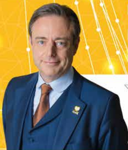
Bart De Wever Algemeen voorzitter

In onze energiemix van de toekomst moet kernenergie een belangrijke rol spelen. Dat is in het belang van het klimaat, onze koopkracht en onze energie-onafhankelijkheid. ”