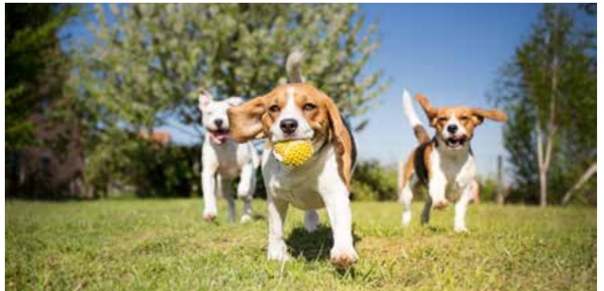
▲ N-VA Hemiksem ijvert voor een veilige omgeving voor onze trouwe viervoeters.

Nadien bleek dat personen met slechte bedoelingen opzettelijk vleesballetjes met rattenvergif in het park hadden gegooid. Daarom onze oproep: laat uw honden niet loslopen en hou ze goed in het oog, zodat ze geen vreemde zaken opeten.