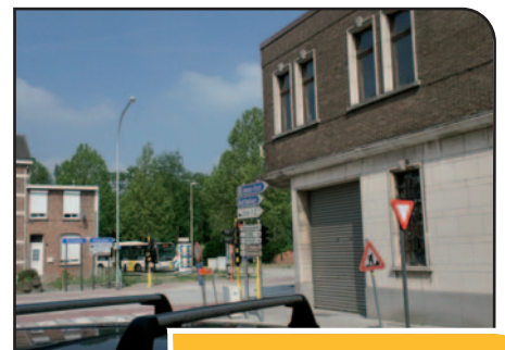
Zoek het verkeerslicht.

Dit zijn enkele voorbeelden van problemen die de inwoners van Hemiksem ons kwamen vertellen. Zijn er in jullie straat ook problemen met verkeersveiligheid? Laat het ons weten. Wij leggen dit voor aan de bevoegde schepen. Bij elke beslissing nemen we contact met u op.