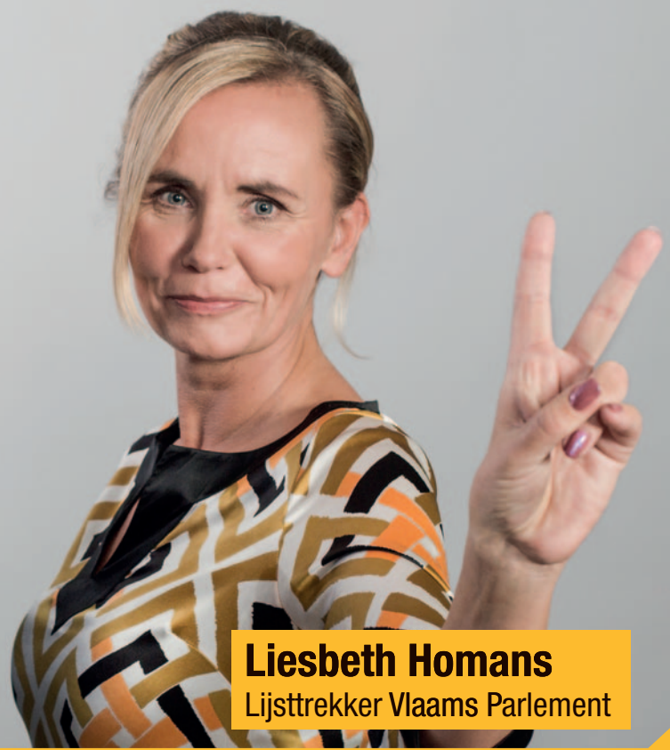
Liesbeth Homans Lijsttrekker Vlaams Parlement

Als burger, als vader en als burgervader zoek ik elke dag oplossingen voor en het welzijn van iedereen die werkt, spaart en onderneemt. Maar zolang we België niet hervormen, staan we machteloos tegenover de hoge belastingen, de faillissementengolf, de verkwistende structuren.