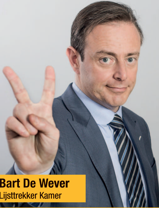
Bart De Wever Lijsttrekker Kamer