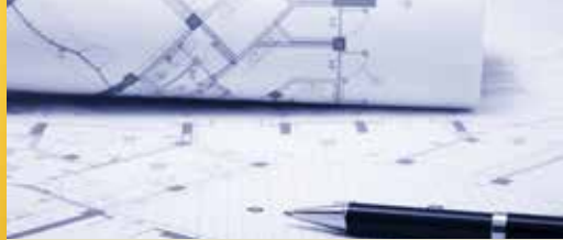
Waarom de N-VA de gemeenteraad verlaten heeft (p. 2)