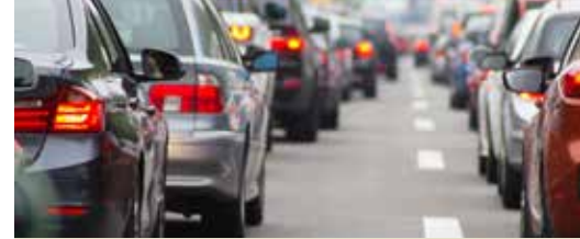
Verkeersfiasco A12 vraagt om bijkomende maatregelen (p. 3)