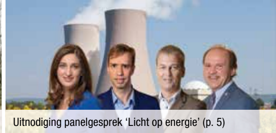
Uitnodiging panelgesprek 'Licht op energie' (p. 5)