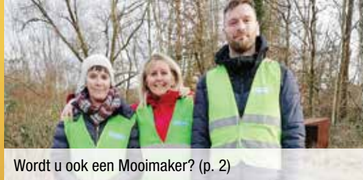
Wordt u ook een Mooimaker? (p. 2)