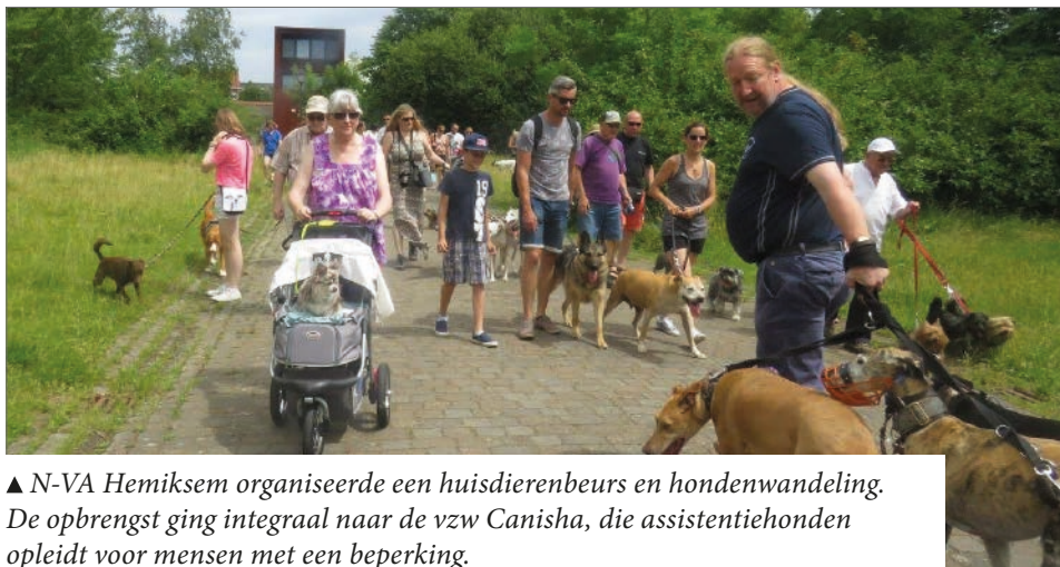
▲ N-VA Hemiksem organiseerde een huisdierenbeurs en hondenwandeling. De opbrengst ging integraal naar de vzw Canisha, die assistentiehonden opleidt voor mensen met een beperking.