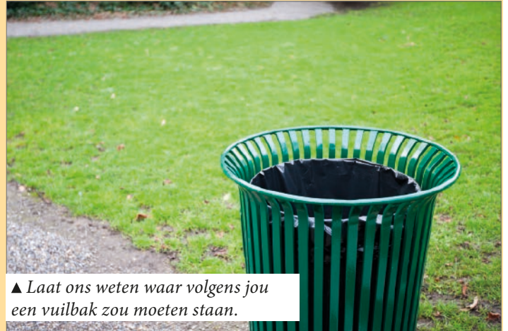
▲ Laat ons weten waar volgens jou een vuilbak zou moeten staan.

Meld het ons via e-mail ( hemiksem@n-va.be ) of geef het door aan één van onze bestuursleden.