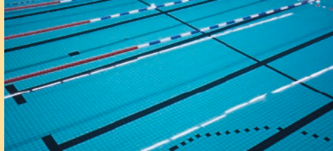
Zwembad in Aartselaar p. 2